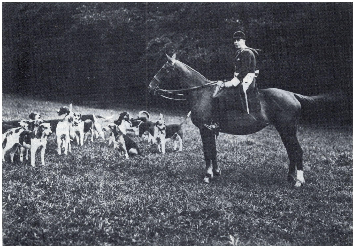
A cheval, le maître d'équipage.